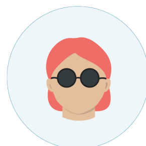
Hearki garra čuvgii