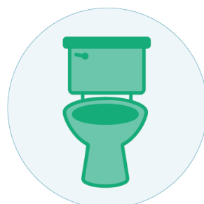
Moiddoda, vuoksá ja lužuha